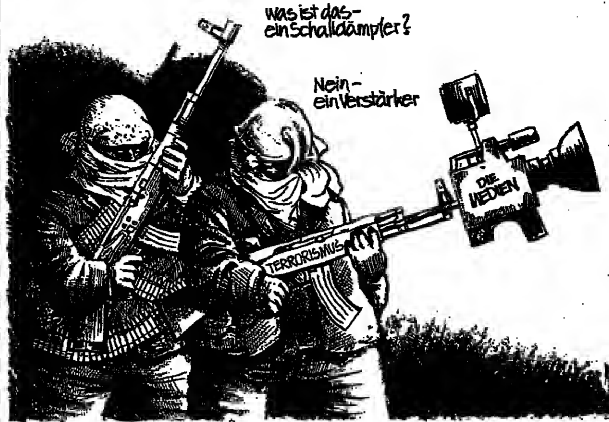
ZEICHNUNG NORMAN/THE MIAMI HERALD